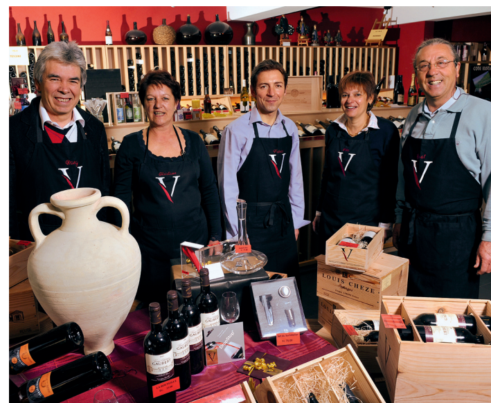
Une partie de l'équipe de La Vinothèque de La Charrière

La plupart de ces viticulteurs se sont d'ailleurs vus par la suite encensés par les médias du monde entier pour le niveau qualitatif "hors norme" de leurs vins.